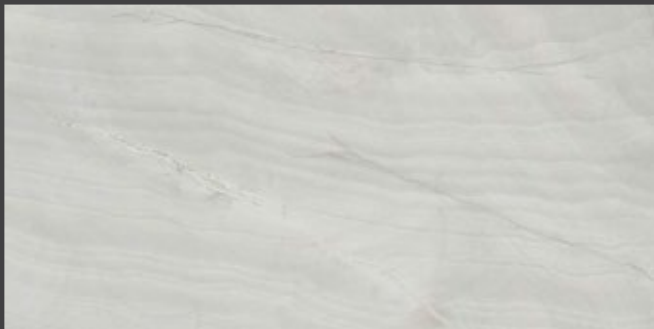
Crema ZOX3 80 X 160 cm. Rectificado