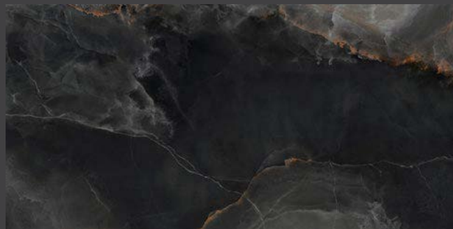
Black ZOX2 80 x 160 cm Rectificado