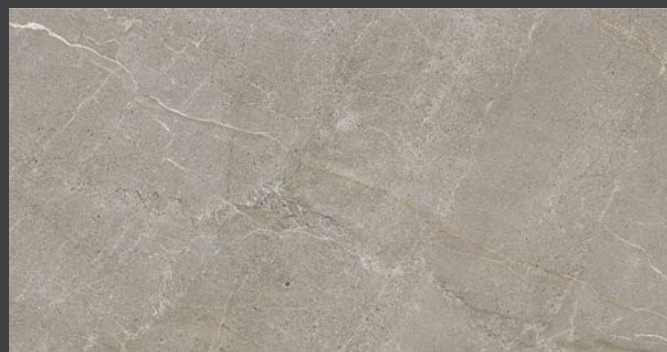
Tortora GAI2 59.6 X 119.4 cm Rectificado