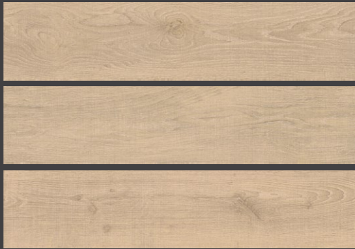
BEIGE GTW1 20 X 90 cm