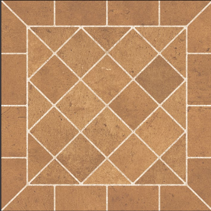
COTTO ZSC7 37 X 37 cm