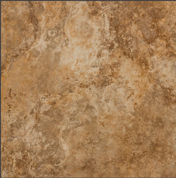
MARRÓN ZL83 45 X 45 cm