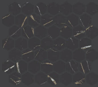
Infinity Black PT24 Malla 29 X 26 cm