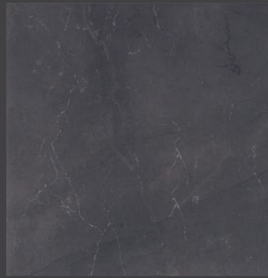
NEGRO PK05 45 X 45 cm