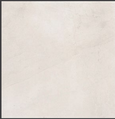
BLANCO PK01 45 X 45 cm