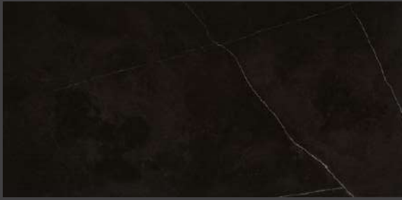
Black GNI1 45 X 90 cm rectificado