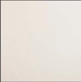
Cream ZH89 80 x 80 cm Rectificado