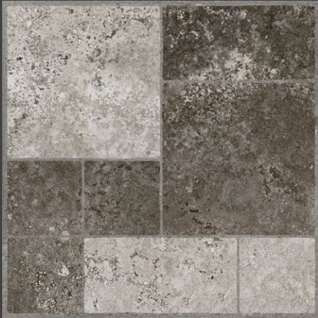
Café ZGX5 45 X 45 cm.