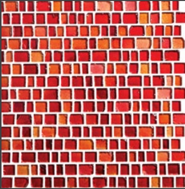
RED ZMS4 31 X 31 cm