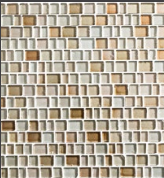
SAND ZMS1 31 X 31 cm