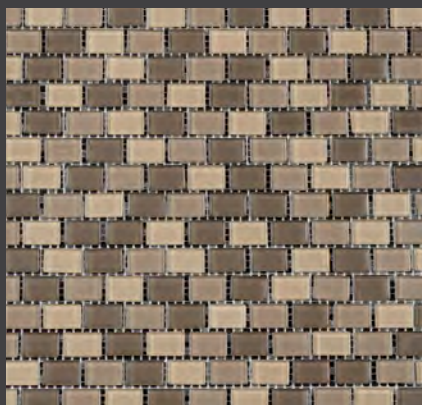
BROWN ZHT1 30 X 30 cm