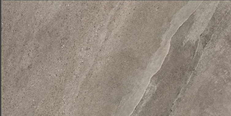
MOKA ZCO7 59 X 118 cm rectificado