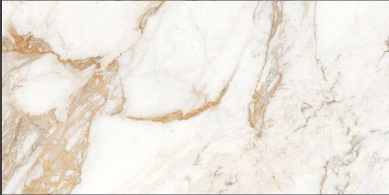
WHITE ZCG5 80 X 160 cm rectificado 60 X 120 cm rectificado