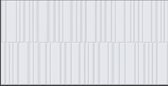
White GAK1 45 x 90 cm Rectificado