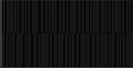
Black GAK2 45 x 90 cm Rectificado