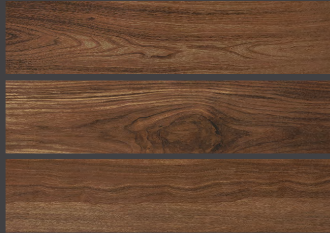
BROWN GAW2 20 X 90 cm 20 X 90 cm rectificado