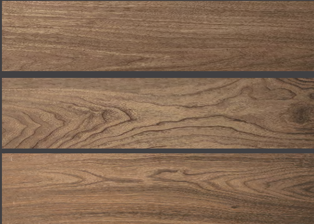
NATURAL GAW1 20 X 90 cm 20 X 90 cm rectificado